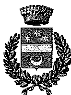
Comune Licciana Nardi