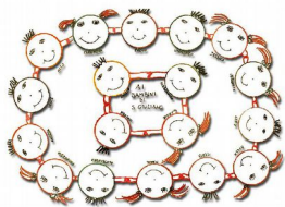
Associazione San Giuliano di Puglia 31/10/2002 ONLUS