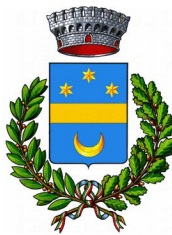
Comune di Licciana Nardi (MS)